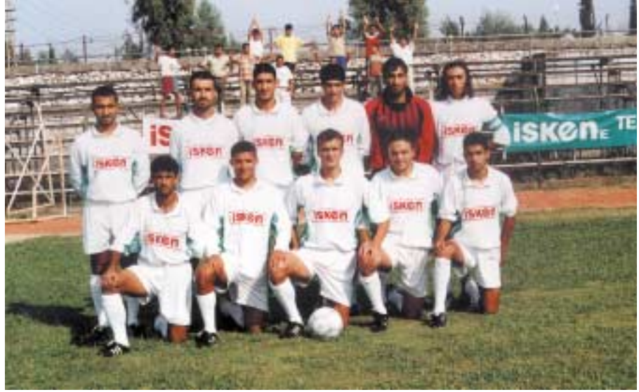
Ceyhanspor 3. ligde başarılı bir performans gösteriyor.

İsken olarak Ceyhanspor'a başarılar dileriz.