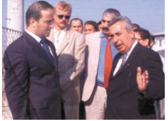
Enerji Bakanı Sayın Zeki Çakan şantiyemizde yetkililerle...

Alınan çevresel koruma önlemlerinden memnun kaldıklarını belirten Sayın Çakan, bu uygulamanın Türkiye'deki diğer projeler için bir örnek teşkil edebileceğini söylemiştir.