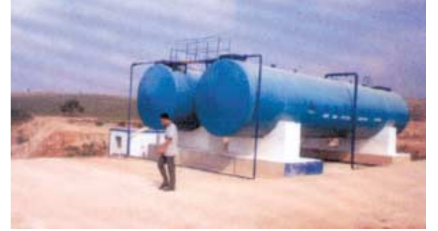
Arıtma üniteleri A1 ve A2

Kamu kurumlarına ait resmi laboratuvarlarda yapılan atıksu analizleri, Su Kirliliği Kontrolü Yönetmeliği (SKKY) ile belirlenen sınır değerlerin altındadır.