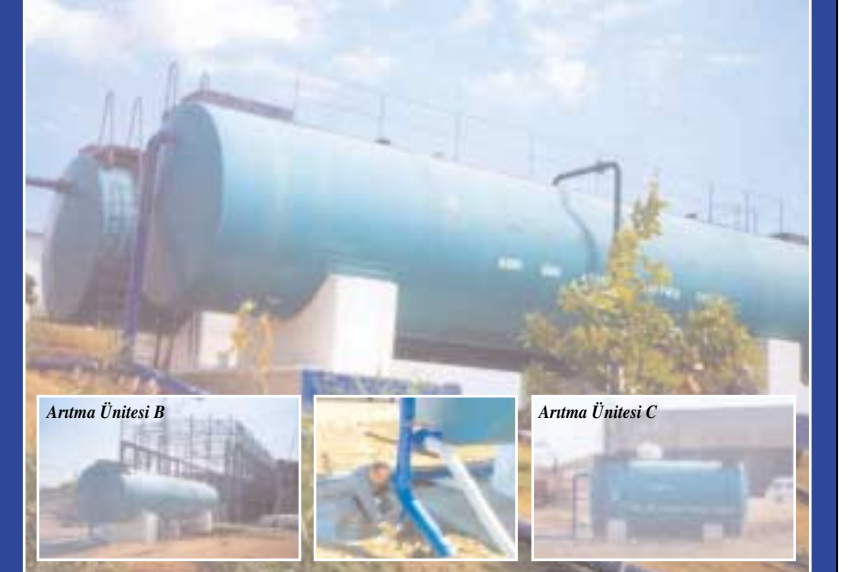
Arıtma Üniteleri A1 ve A2

İzleme programı çerçevesinde, inşaat sahasında yer alan atıksu arıtma ünitelerinden (A1, A2, B ve C) yapılan deşarjlar her ay kontrol edilmektedir. Analiz sonuçlarına göre, arıtma ünitelerinden alınan atıksu örneklerinde, BOİ, KOİ ve AKM parametrelerinin Su Kirliliği Kontrolü Yönetmeliği ile belirlenen sınır değerleri sağladığı görülmüştür. Arıtma üniteleri için deşarj izin belgesi alınmıştır.