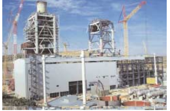
Santralin inşaatı hızla sürüyor.

Sahada yapılan çalışmalar ziyaretçilerimiz tarafından ilgi ve takdirle karşılanmaktadır.