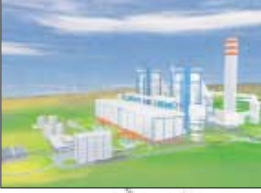
Sugözü Enerji Santrali maketi