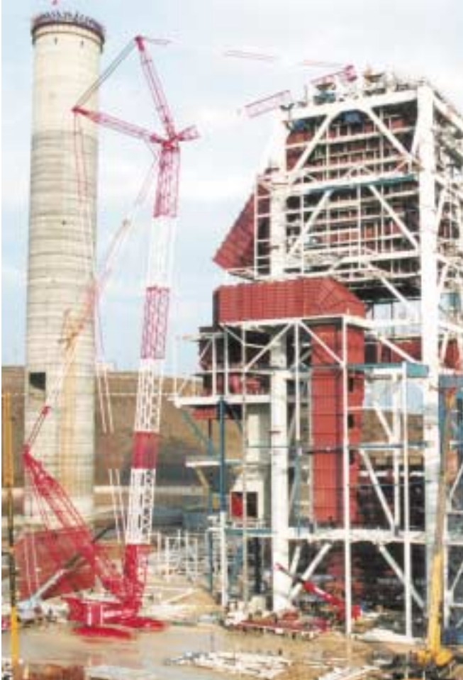
İnşaat alanından bir görüntü.