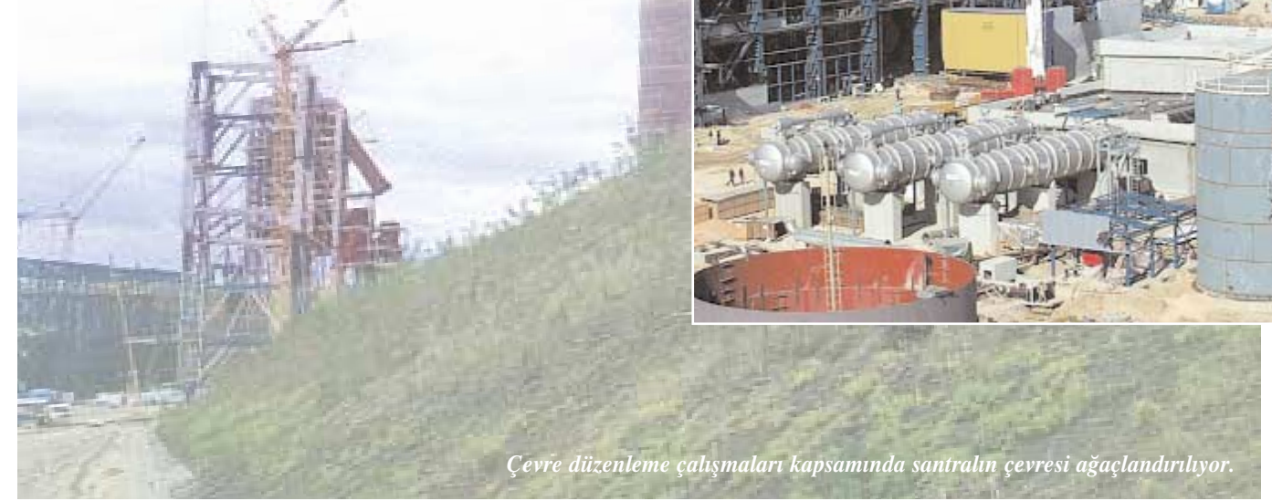
Çevre düzenleme çalışmaları kapsamında santralin çevresi ağaçlandırılıyor.